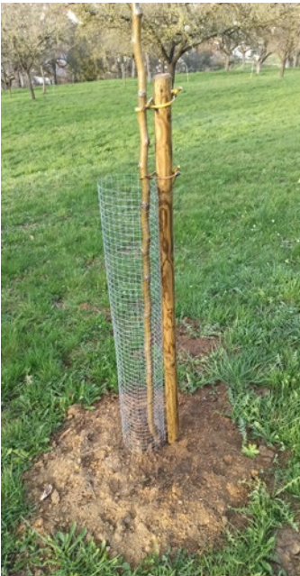
Pfahl und Verbisschutz